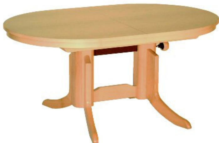
Gestell CW 08