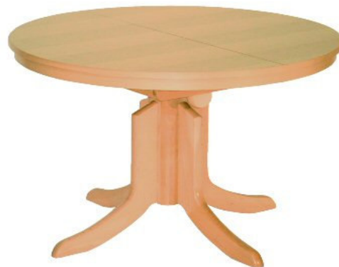
Gestell CG 08

Tisch MELAMY Modellreihe NEUSTADT Modell CE/COE/CBOE Gestellfußtisch rund/oval Platte Melaminharz, 38 mm Optik Standardauszug Höhenverstellbar mit Gashublif Zargenrahmen Melaminharz 19 mm stark Gestellfuß wählbar, Grundholz Buche, gebeizt (Gestellfußübersicht Seite 2 Programm Couchtische)